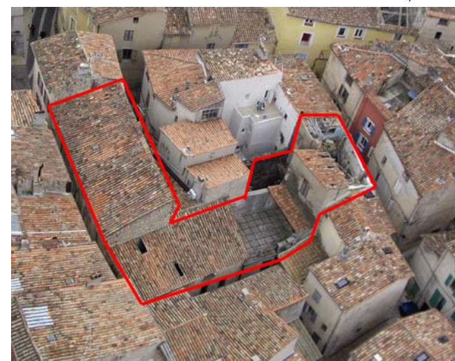
Site 1 - Glacière-Robinet