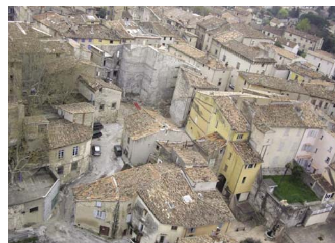
Site 6 - Rue de l'Hôpital Vieux