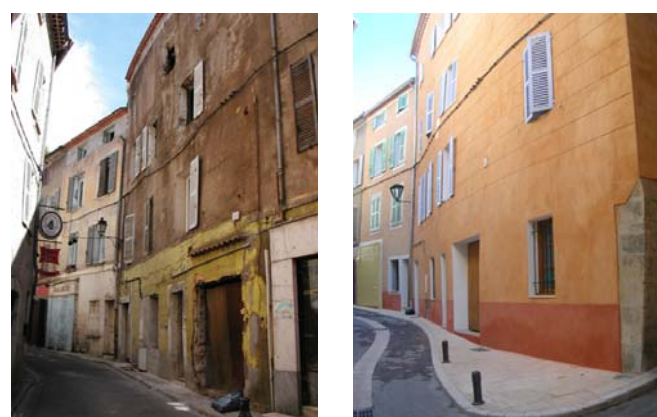
Une réhabilitation réalisée rue Cavallon à Brignoles

Sur la période 2007-2009, la direction départementale de l'équipement du Var va mener des actions de formation/communication en direction des collectivités locales, notamment en matière de péril et de pouvoir de police administrative du maire. La mise en place d'un dispositif partagé de suivi des dossiers de logements indignes sur la base du programme ORHEP (observatoire régional de l'hébergement de l'Etat et de ses partenaires) permettra de recouper les données disponibles. Des actions spécifiques sont envisagées en matière de droit des occupants et de relogement, en particulier sur les sites en renouvellement/rénovation urbain. Le renforcement des PDALPD avec prise en compte de l'habitat indigne sera effectué en liaison avec le Conseil général. Une action de sensibilisation/formation à la LHI en direction des travailleurs sociaux du département devra être mise en place. Enfin la prise en compte d'une manière plus opérationnelle de l'habitat indigne dans les PLH sera réalisée avec les communautés en charge de ces programmes.