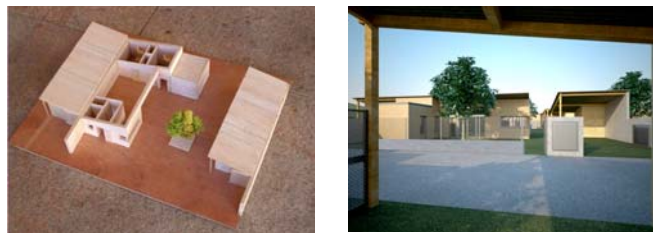
Maquette et montage photographique du projet